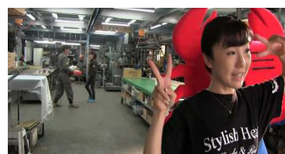
関係者以外立ち入り禁止の工場でも撮影