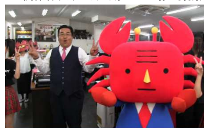
カニ部長と共に踊る社長