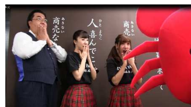
「静カニ！」社長に注意するカニ部長