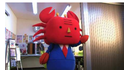
シャッターを開けながらカニ部長登場