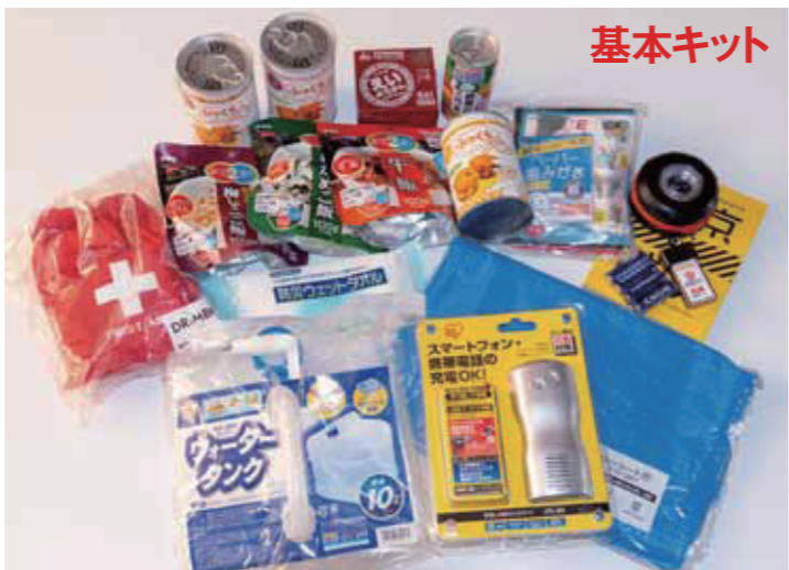
ブルーシート、ウォータータンク(10L)、多機能ラジオライト、防災用灯、折りたたみランタン白色系LED、単三乾電池(4本)、ペーパー歯みがき(5包)、防災ウェットタオル、救急セット巾着タイプ、災害用備蓄パン ふっくらパン、野菜一日これ一本(長期保存用)、えいようかん、梅じゃこご飯、わかめご飯、牛飯。

東日本大震災をきっかけに、自社で備える必要性を感じていた防災グッズの準備に着手。ホームセンター等の防災セットを調査すると、人によって必要ない物が入っていることがわかった。一方、防災グッズは社員のものだけでなく、家族分も備えることを当初から考えた。会社は社員がいて成り立ち、社員は家族がいて成り立つからだ。家族分の防災グッズは家族構成によって必要なものが変わって」トッキ本基「、し談相と者業や員社。るく女「」け向者齢高「」け向もど子「、にもとと性向け」の3パーンを設定。こうして2015年に、家族構成に応じてカスタマイズした防災グッズができあがった。