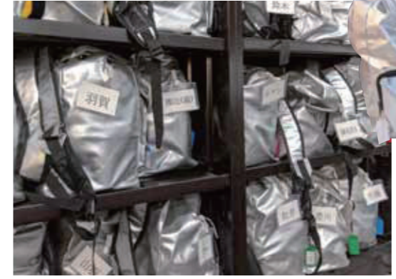
社員それぞれの氏名が記入された防災キット