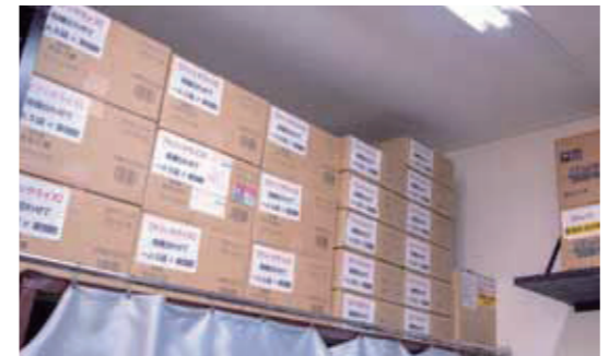
防災キット以外に水と食料を配備。発災時にも取り出しやすい工夫