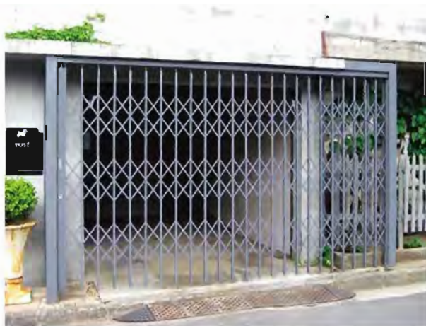
W3,600×H2,100 スチール製(標準色:グレー) 片引き仕様、下レールなし