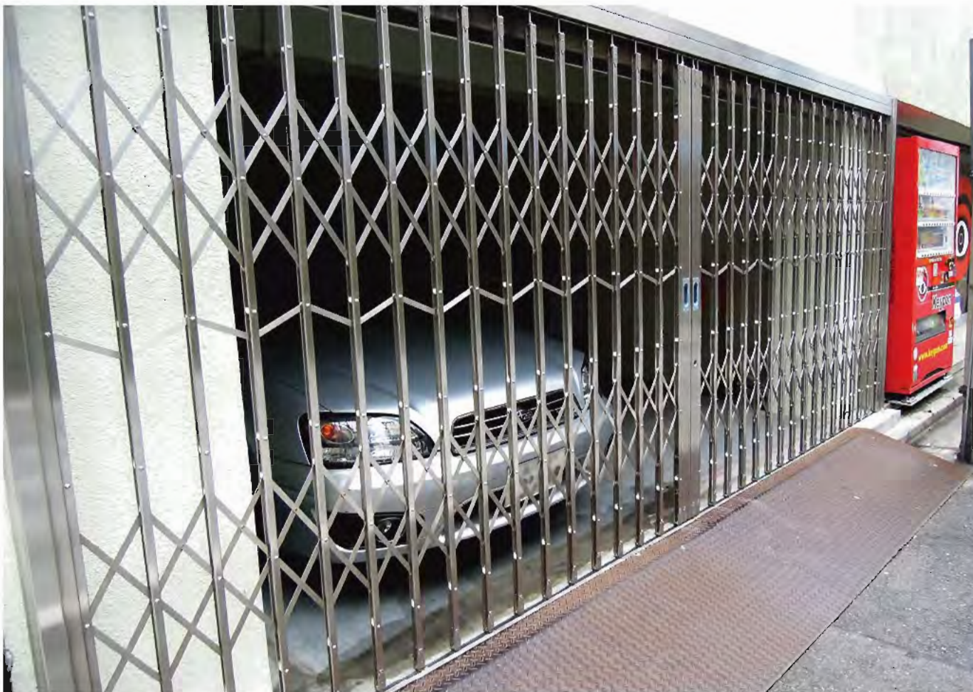
W5,000×H2,100 ステンレス製、両引き分け仕様