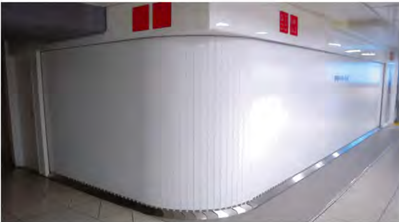
曲面にも対応できる

横引き式シャッターはカーテンと同じように、左右に開閉できるシャッターであり、上下式シャッターに比べ、いくつかのメリットを持つ。上下式では1枚のシャッター幅が7～8メートルに決められているので、横に長くする場合は途中で柱を立てて、つないでやる必要がある。一方、横引き式シャッターは最大で約50メートルの長さまで一枚で設置することができる。また曲面を描くような構造にできるのも上下式にはない特長で、天井にシャッターボックスを置く必要もない。