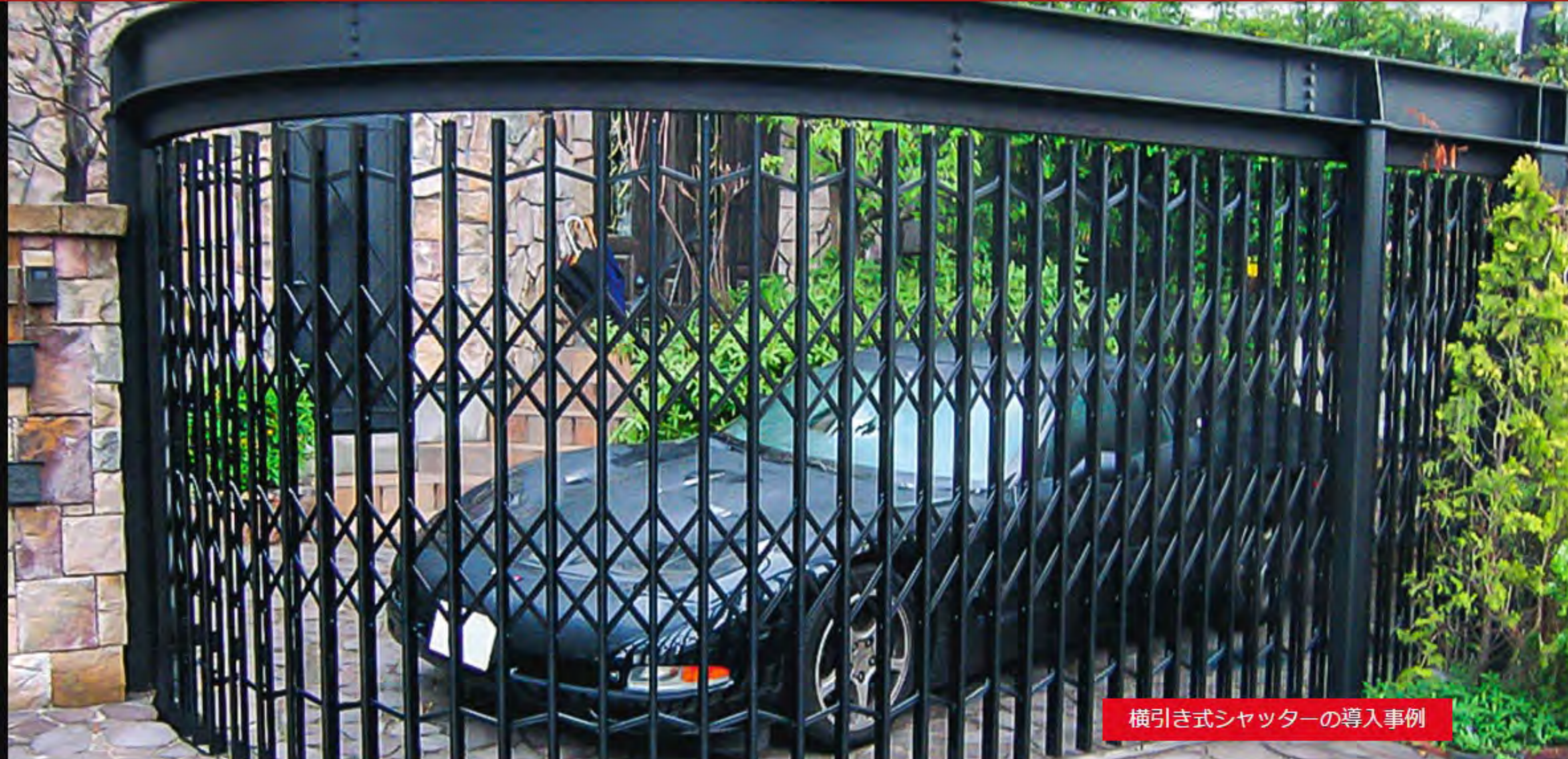
横引き式シャッターの導入事例